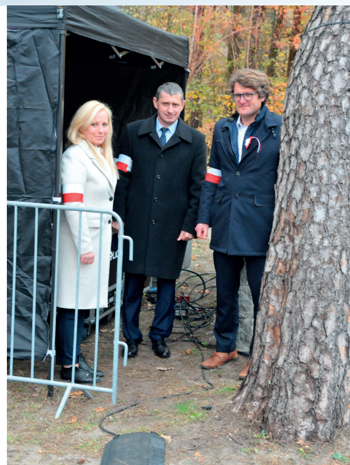
we ukoronowanie dnia pełnego wzruszeń i refleksji.